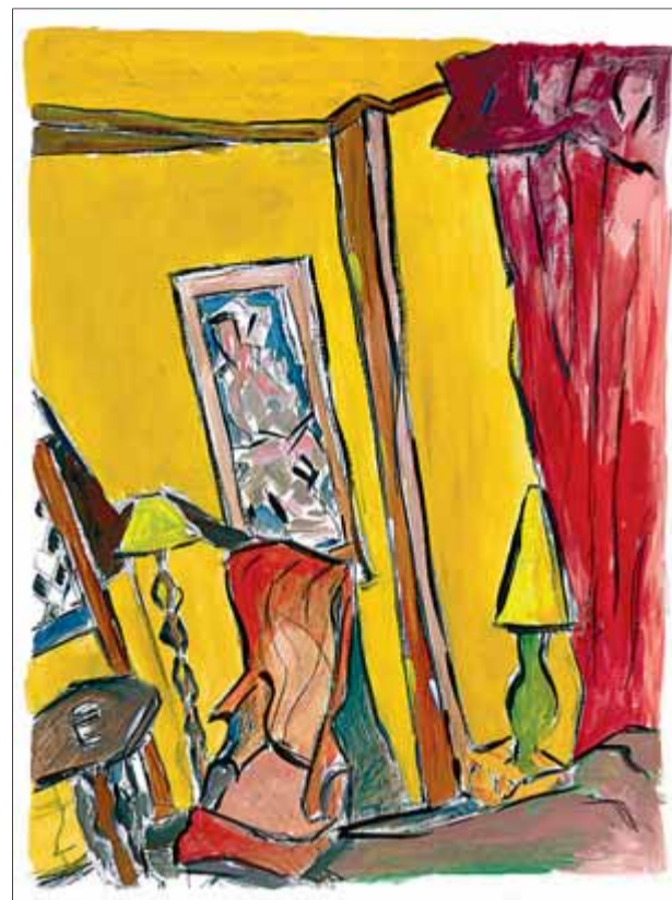
'Bragg apartment', obra pintada a Nova York el 2007 per Bob Dylan i que ara s'exposa a Londres